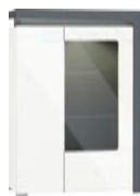
witryna WHW-2P 102/148,5/42,8