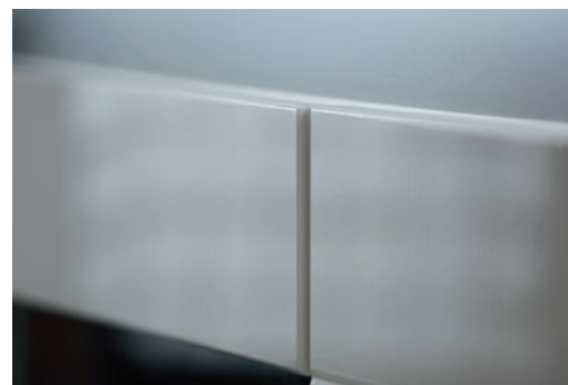
połyskowe fronty MDF