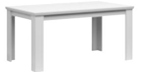
stół rozkładany 160/200 folding table 160/200 160-200 / 77 / 91 cm