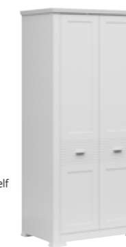
szafa 2d wardrobe 2d 95 / 200 / 59 cm