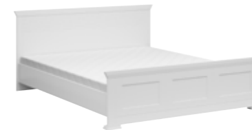
łóże 160 bed 160 175 / 80 / 210 cm bez materaca i wkładu without insert and mattress