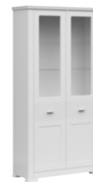
witryna wysoka 2w high site 2w 105 / 200 / 40 cm oświetlenie w opcji lighting in option