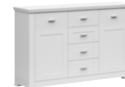
komoda 2d4s chest of drawers 2d4s 148 / 92 / 40 cm