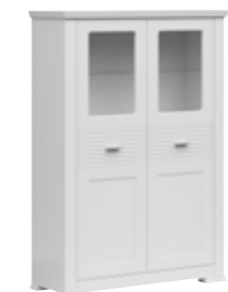
witryna niska 2w low site 2w 105 / 150 / 40 cm oświetlenie w opcji lighting in option