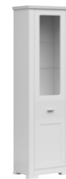
witryna 1w site 1w 61,5 / 200 / 40 cm oświetlenie w opcji lighting in option