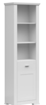
regał otwarty 1d open bookcase 1d 61,5 / 200 / 40 cm