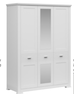
szafa z lustrem 3d wardrobe with mirror 3d 148 / 200 / 59 cm