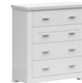
komoda 4s chest of drawers 4s 90 / 92 / 40 cm