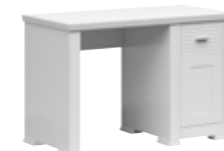
biurko 1d/115 desk 1d/115 115 / 75 / 57 cm