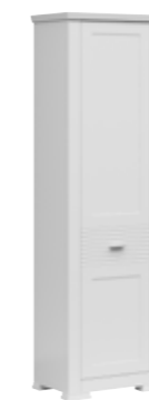
regał 1d bookshelf 1d 61,5 / 200 / 40 cm